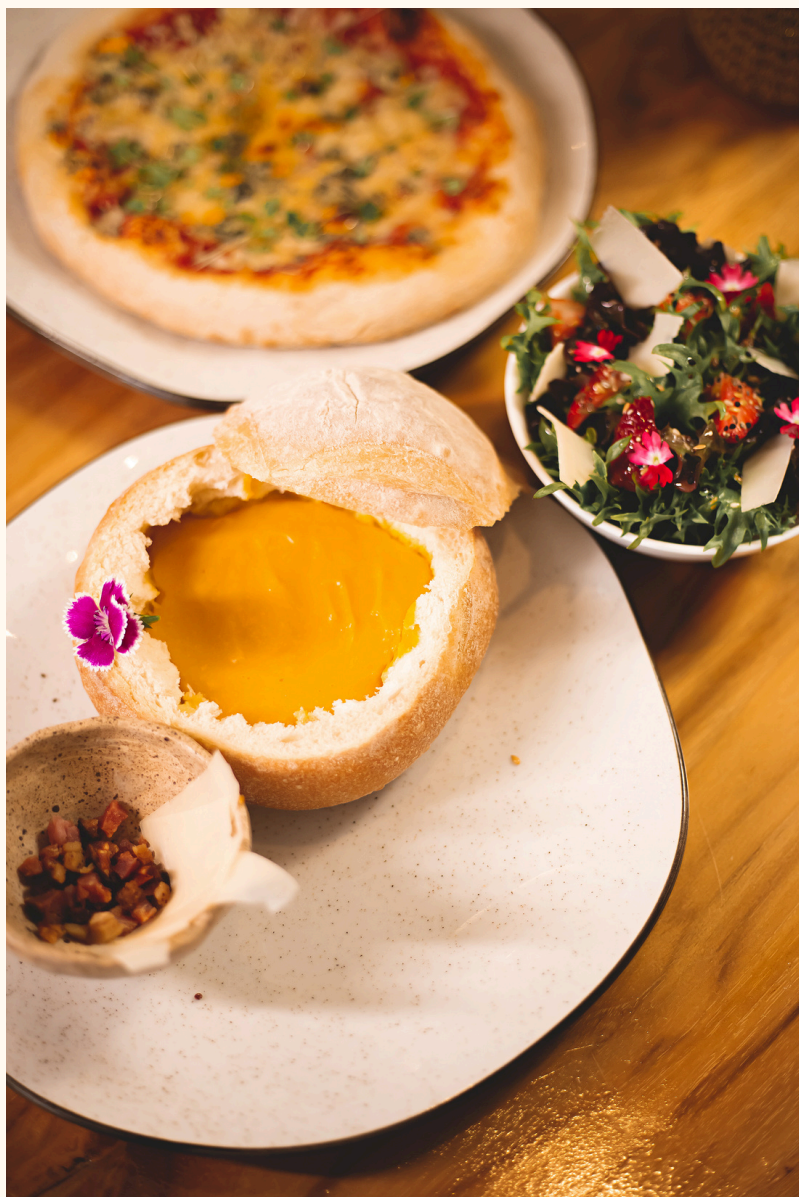
SOPA NO PÃO E PIZZA DA CB