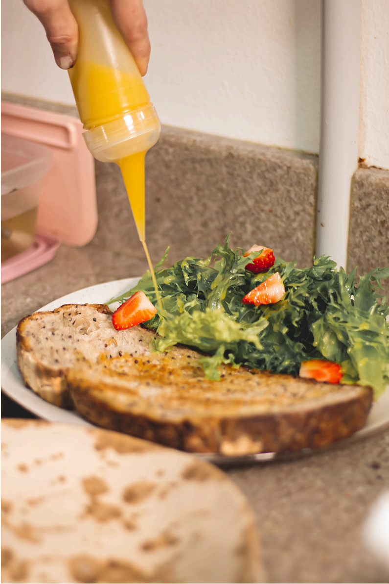
PREPARO DAS TARTINES