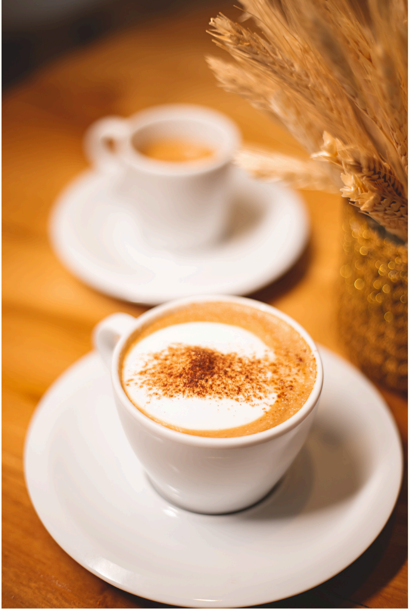
ESPRESSO E CAPUCCINO TRADICIONAL