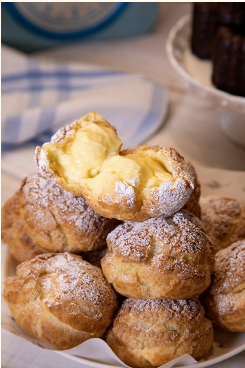
CHARLIE CREAM, RECHEADADA NA HORA. DISPONÍVEL NOS SABORES, BAUNILHA, CHOCOLATE OU BAUNILHA COM MAÇÃ